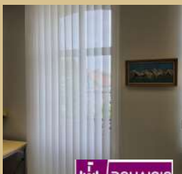
Installation de stores à la mairie et à la salle de musique (1840 euro de subvention de Douaisis Agglo).