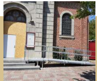
Installation à l'église d'une rampe provisoire pour les personnes à mobilité réduite et rénovation de la porte et des marches.