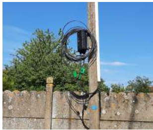
Installation de la fibre à l'école et rue du 11 novembre.