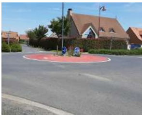
Modification du giratoire de la rue de Goeulzin.