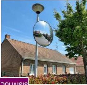
Remplacement ou ajout de miroirs de rue (1126,20 euro de subvention de Douaisis Agglo).