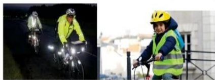
SENSIBILISATION A LA PREVENTION ROUTIERE JOURNEE D'ACTION SE RENDRE VISIBLE A VELO